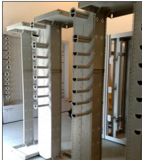
Professionel stativ med fokus for kabelmanagement